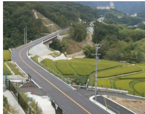
＜有馬山口線バイパス＞