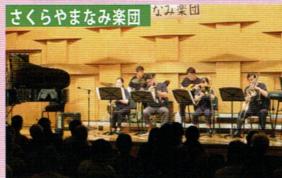
さくらやまなみ楽団 なみ楽団