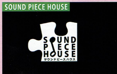
SOUND PIECE HOUSE