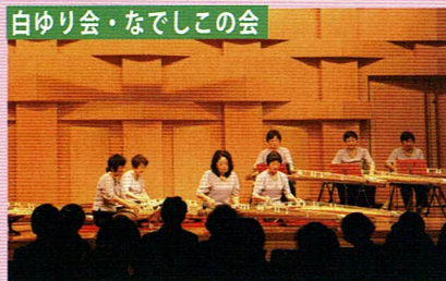
白ゆり会・なでしこの会