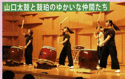
山口太鼓と鼓粕のゆかいな仲間たち