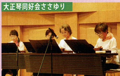
大正琴同好会ささゆり