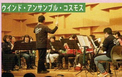
wind・アンサンブル・コスモス