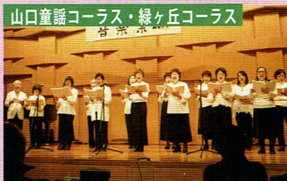
山口童謡コーラス・緑ヶ丘コーラス