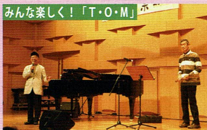
みんな楽しく!「T・O・M」