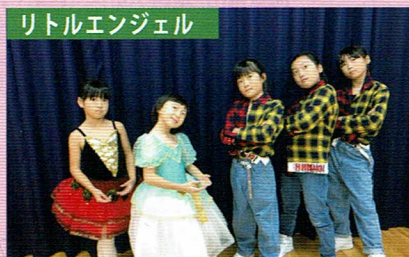
リトルエンジェル