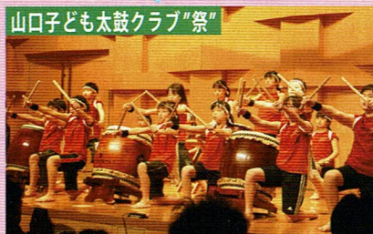
山口子ども太鼓クラブ「祭」