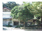
保護樹木のヤマモモ

延喜式神名帳に記されている式内社で、木の祖神の久能智神を奉祀するのが始まりとされています。境内には、スギ、クス、クロマツ、ヤマモモの保護樹木があります。