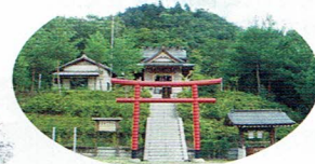
丸山稲荷神社本社