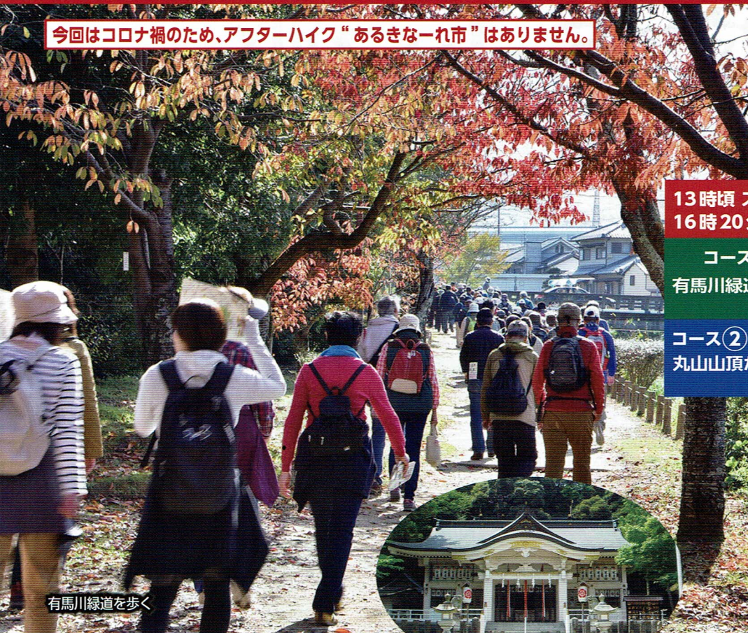
有馬川緑道を歩く