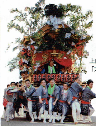
上山口 「大だんじり」