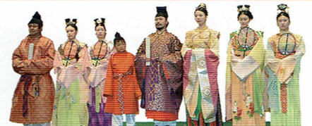
郷土資料館からは孝徳帝の古代衣装行列も参加します (写真はイメージです)