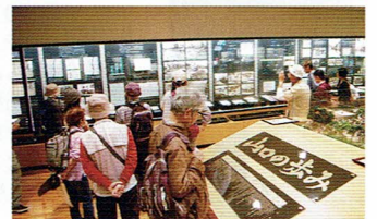
郷土資料館展示風景