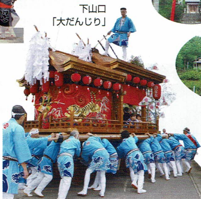
下山口 「大だんじり」