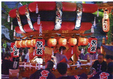
名来「かきだんじり」

コースハイキングの後、山口センターに集結の3地区のだんじりの解説を聞き、実物に触れるなどの体験をした後、だんじりの宮入りをご覧いただけます。